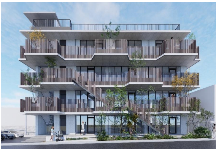
【建物外観パース(正面)】