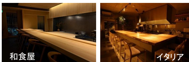
【テナントイメージ写真】